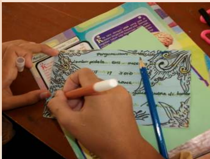
Siswa membuat announcement

Setelah itu siswa berdiskusi untuk memahaminya dengan menjawab pertanyaan guru secara lisan terlebih dahulu dan kemudian tertulis. Pertanyaan diberikan secara tertulis. Setelah itu dengan dibimbing guru, kelas merangkum kata-kata yang mereka dapat dari kegiatan tersebut. Guru meminta kopi dari announcement yang tadi dibaca siswa. Berikutnya, siswa membuat bermacam-macam announcement bersama kelompoknya. Siswa diperbolehkan menulis ulang announcement yang tadi dibacanya tapi yang kopinya sudah diserahkan ke guru, atau membuat yang benar-baru. Dengan demikian ada ruang untuk guided dan free composition . Dari aktivitas siswa, terciptalah announcement tree .