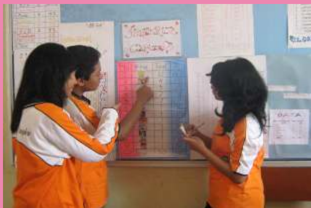
Menyampaikan secara lisan laporan hasil survey pada teman dalam bahasa Inggris.

Neighborhood walk activities: kegiatan berjalan-jalan mengenali dan mengamati lingkungan sekitar dengan fokus pengamatan tertentu tergantung target pembelajaran. Lingkungan yang dimaksud bisa bisa lingkungan sekitar rumah, sekolah, atau kelas.