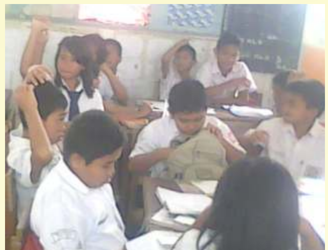
Siswa berlatih berdialog berdasarkan teks bertelepon yang mereka susun bersama setelah terlebih dahulu menyepakati 2 orang perwakilan kelompok untuk mensimulasikan tata cara bertelepon.

Refleksi berlangsung selama 3 menit. Secara bersama, siswa dan guru melakukan refleksi terhadap pengalaman belajar yang sudah dilakukan. Kegiatan itu dilanjutkan dengan kegiatan extension selama 2 menit. Siswa mendengar penekanan guru yang menghubungkan kompetensi yang mereka miliki dengan kecakapan hidup siswa.