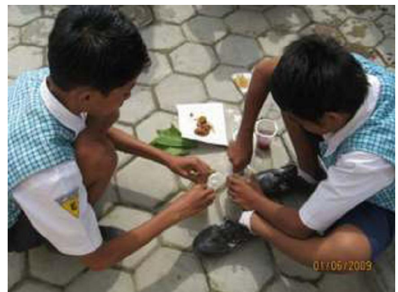
Dua orang siswa SMPN 6 Bojonegoro sedang melakukan praktek IPA sebagai bagian dari sesi real teaching