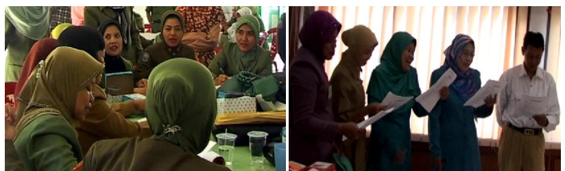
Proses pelatihan BTL 2 di Sulse: Peserta selama mengikuti sesi pelatihan aktif, dan saat praktik mengajar juga mampu membuat aktif siswa dalam belajar.