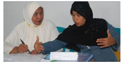
Dua peserta BTL 2 gelombang II di Tanjungbalai, tampak serius dalam menyiapkan RPP

Pertama , Siswa perlu diberikan kegiatan-kegiatan yang bersifat kontekstual, menantang dan lebih beragam untuk membangun kecakapan hidup mereka.