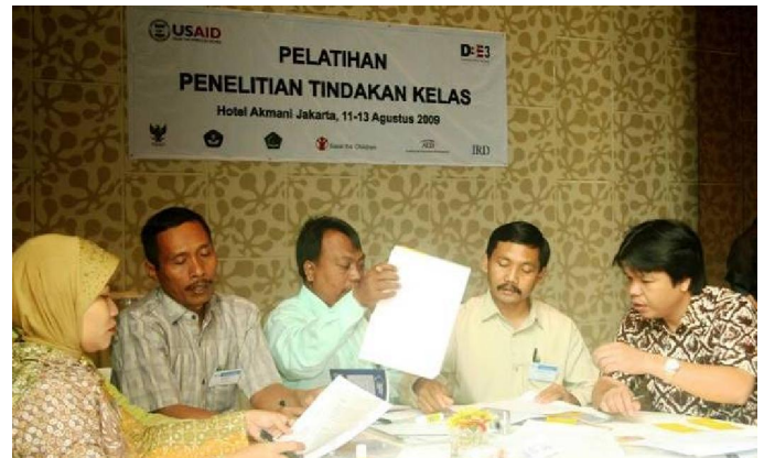
Peserta pelatihan Penelitian Tindakan Kelas yang terdiri dari fasilitator daerah, guru dan unsur LPTK/LPMP sedang berdiskusi dalam kelompok.

Tiga hal menarik dalam pelatihan ini. Pertama, kolaboratif. Pelatihan ini melibatkan unsur guru sekolah binaan, LPTK, dan LPMP. Kedua, praktis. Pelatihan langsung diarahkan pada identifikasi permasalahan pembelajaran dan bagaimana menyusun rancangan penelitian.