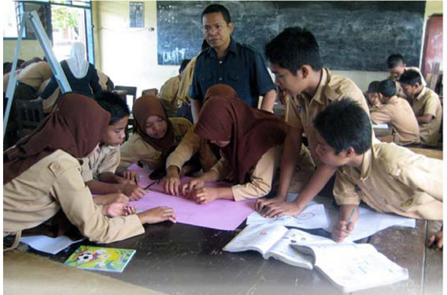
Praktek Mengajar (Real Teaching)

Materi yang dilatihkan adalah: (1) pembelajaran CTL dalam pengembangan kecakapan hidup, (2) bagaimana merancang pembelajaran untuk meningkatkan kecakapan hidup, (3) bagaimana menciptakan kelas yang mendorong siswa untuk belajar, (4) persiapan dan praktik