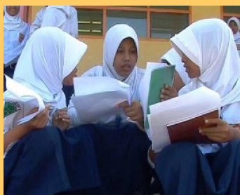
Siswa bekerjasama dalam kelompok menjawab lembar kerja