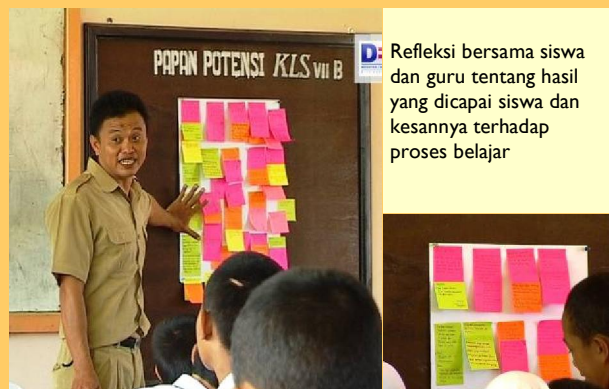
Refleksi bersama siswa dan guru tentang hasil yang dicapai siswa dan kesannya terhadap proses belajar

Kebersamaan siswa belajar lebih kuat, dan secara alami terbangun learning community di kelas