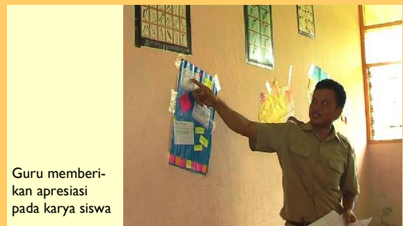
Guru memberikan apresiasi pada karya siswa