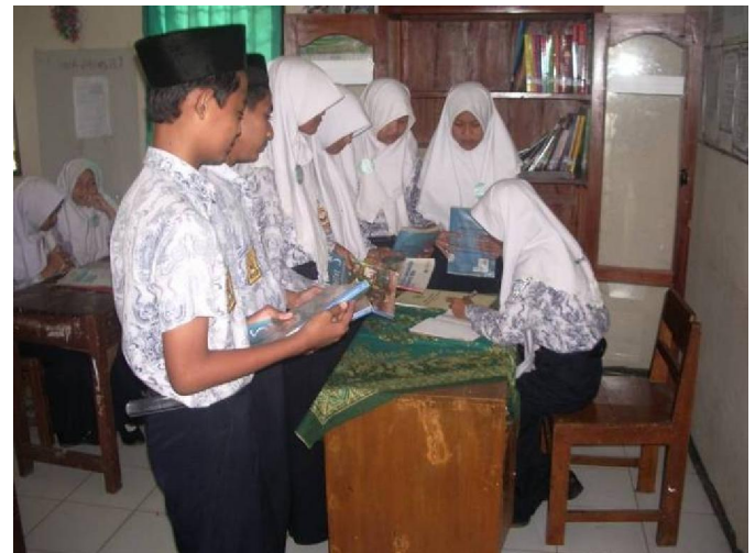
Siswa-siswi MTsN Kudus sedang menunggu giliran untuk meminjam buku dari perpustakaan

OSIS. Hal serupa juga dilakukan oleh SMP NU Assalam Nalumsari, Jepara yang mendapat dukungan dari wali murid. Di SMPN 1 Tahunan dan MTs Masalikil Huda, orang tua siswa berpartisipasi dengan menyumbangkan rak buku dan almari untuk penyimpanan buku. Pemanfaatan perpustakaan kelas ini amat terasa di SMPN 1 Tahunan. Volume peminjaman buku tergolong tinggi. Hampir setiap hari siswa meminjam buku dari perpustakaan. Ibu Ngatiah, wali kelas VII A di sekolah ini mengatakan bahwa akibat dari tingginya frekuensi peminjaman buku, pengurus perpustakaan harus mengatur ulang jadwal peminjaman buku agar sirkulasi peminjaman buku menjadi lebih lancar.