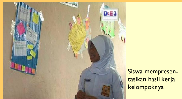
Siswa mempresentasikan hasil kerja kelompoknya

Siswa mengelompokkan sampah sejenis, seperti sedotan, gelas plastic bekas, dan daun-daun kering yang sudah dikumpulkan sebagai media untuk menjumlahkan suku-suku sejenis