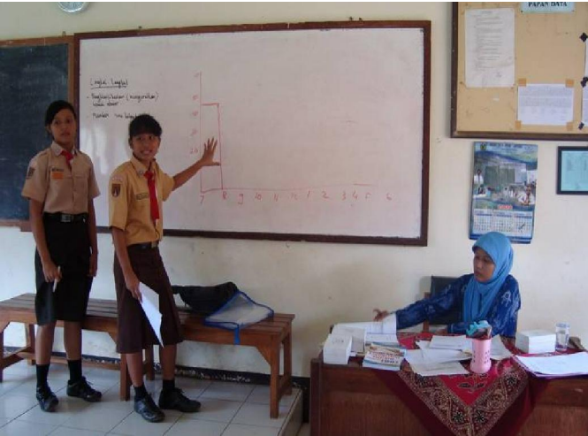
Suasana pembentukan struktur organisasi perpustakaan kelas di SMPN 1 Tahunan

SALAH satu masalah dan hambatan bagi siswa selama ini dalam proses belajar adalah keterbatasan buku teks. Buku teks yang menjadi pegangan wajib bagi siswa tidak selalu mudah untuk didapat. Biasanya para siswa yang memerlukan buku teks akan meminjam dari perpustakaan sekolah. Namun, tidaklah mudah mendapatkan buku di perpustakaan sekolah, mengingat jumlah buku yang tersedia tidak sebanding dengan jumlah siswa yang memerlukan buku.