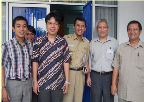
Tim DBE3 Sumut berpose dengan Wagub Sumatera Utara (tengah) setelah pembukaan pelatihan untuk fasilitator daerah

”Tugas guru tidak hanya mengajarkan mata pelajaran. Guru harus bisa berperan sebagai orang tua, sahabat, atau kakak bagi siswanya. Guru harus bisa menggugah siswa