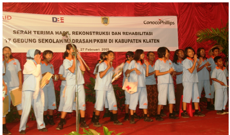
Siswa SMPN 1 Jogonolan, Klaten, sedang tampil pada acara serah terima sekolah di Klaten.

Para siswa yang tampil dalam kegiatan ini juga ikut serta dalam pembuatan buku saku ‘Siaga Gempa’. Drama yang mereka tampilkan adalah salah satu cara untuk mempublikasikan isi dari buku saku tersebut. Penampilan mereka disambut dengan meriah.