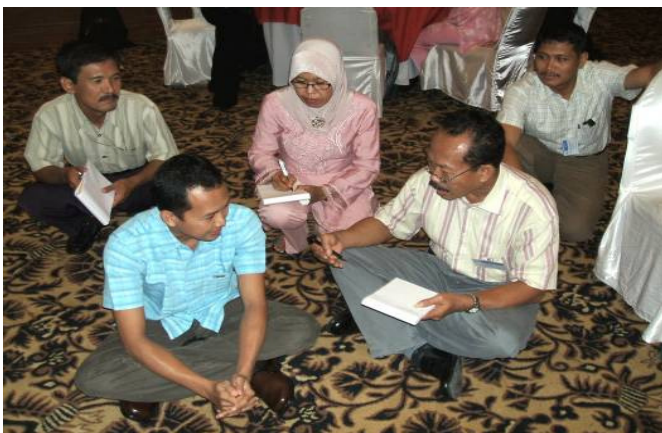
Para peserta sedang praktik pendampingan pada pelatihan nasional

Tiga topik lainnya yang hanya dipelajari dalam pelatihan fasilitator nasional dan fasilitator daerah adalah: