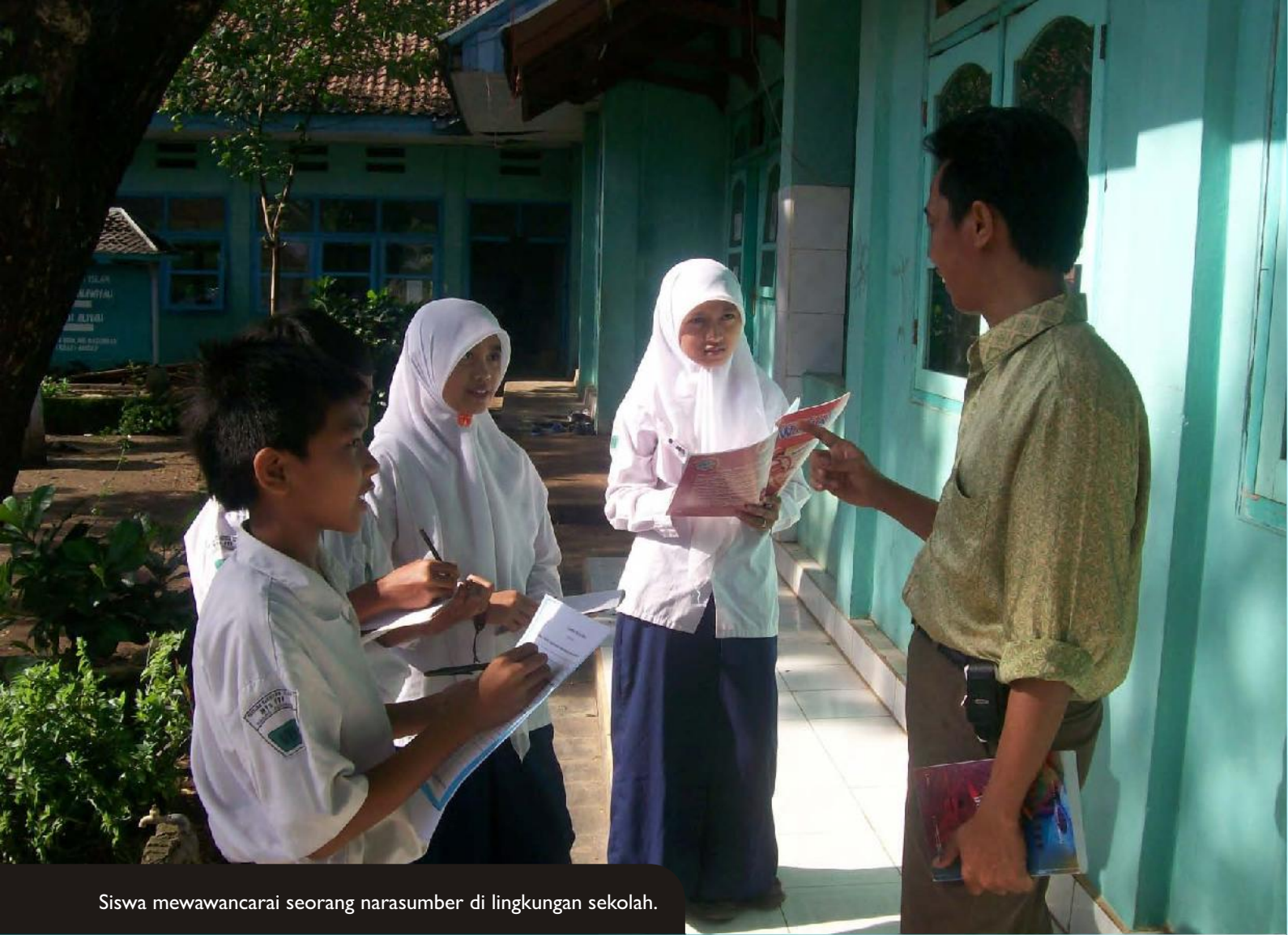
Siswa mewawancarai seorang narasumber di lingkungan sekolah.