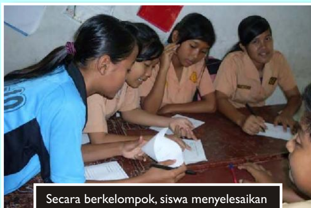
Secara berkelompok, siswa menyelesaikan LK tentang menyempurnakan pantun yang rumpang

Reflection dan Extention (5') Guru memberi kesempatan kepada siswa untuk menulis refleksi. Guru lalu memberikan PR berupa menulis tiga bait pantun kepada siswa. PR ini nantinya akan dikumpulkan dan dijadikan buku berisi pantun-pantun karya siswa.