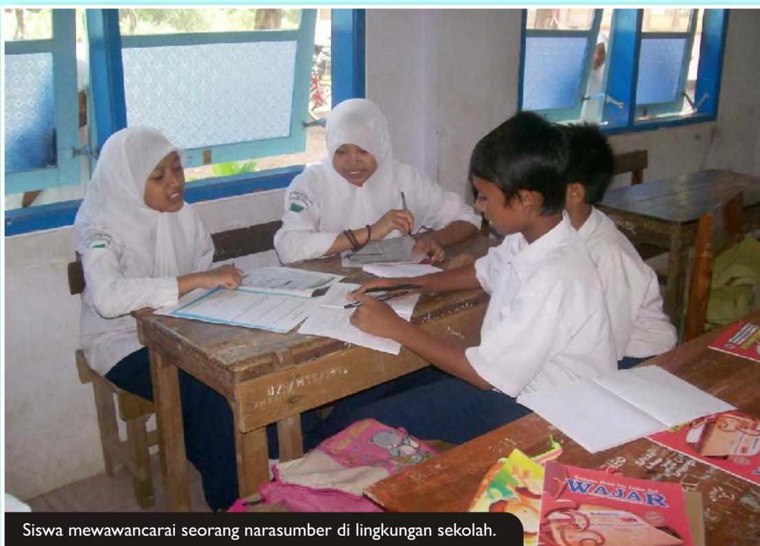
Siswa mewawancarai seorang narasumber di lingkungan sekolah.

Pada tahap Extention , saya memperkuat penguasaan kompetensi berwawancara tersebut agar siswa membiasakan diri untuk melakukannya dalam kegiatan sehari-hari.